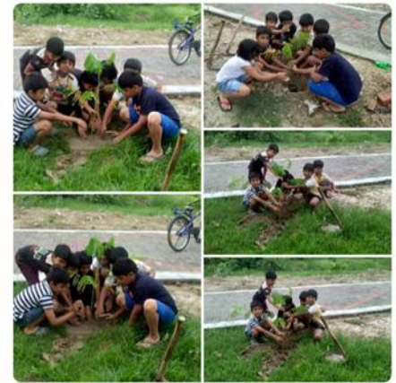
वीर बहादुर सिंह पूर्वांचल विश्वविद्यालय परिसर कालोनी के नंदे मुंने प्यारे वच्चे पौध रोपण करते हुए अपने आवास के सामने 28.07.2019