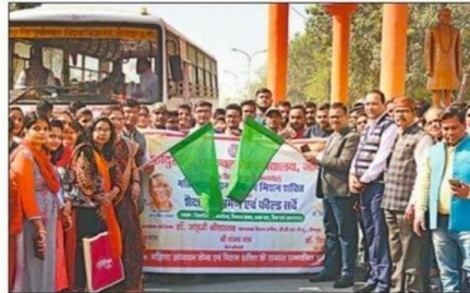
जिला कारागार में बंदियों से मुलाकात करने जा रहे पूर्वांचल विश्वविद्यालय के छात्र और शिक्षक। विज्ञापित